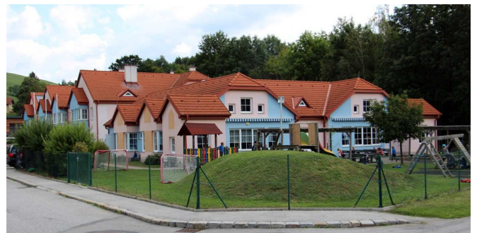
Kindergarten und Seniorenwohnheim in der Arnoldigasse.

Als Portalort in der Erlebnisregion Schneebergland mit seinen 18 Mitgliedsgemeinden ist Puchberg maßgeblich dafür zuständig, den ausgezeichneten Ruf unserer Region in alle Welt zu tragen.