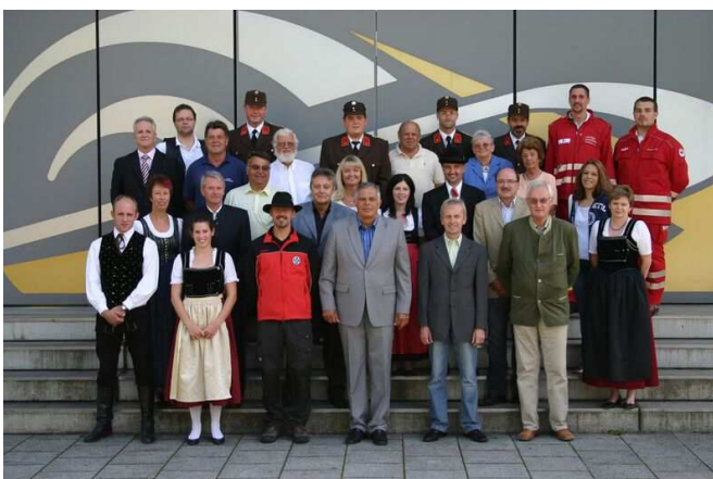
Die Vereine tragen wesentlich zum Sport- und Kulturleben im Ort bei.